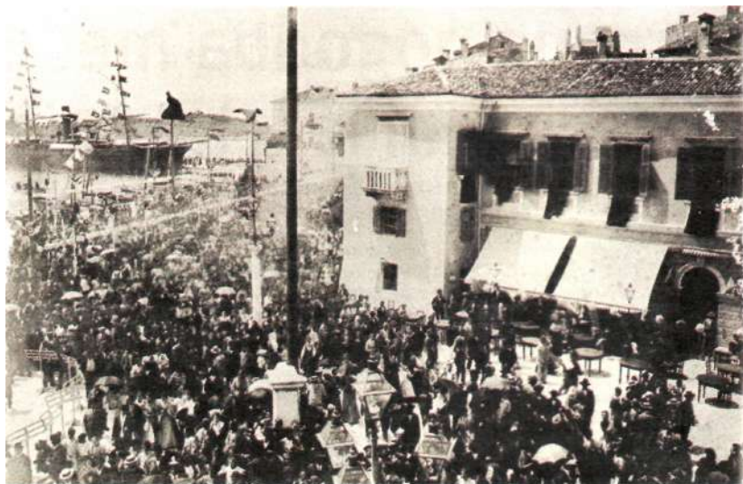
Pirančani na obisku v Rovinju, 5. julija 1896 (visita festosa). Na slavje so prispeli z bogato okrašeno ladjo.

poroča, da prijateljske vezi med Piranom in Rovinjem odslej niso bile nikoli več pretrgane. Obstaja